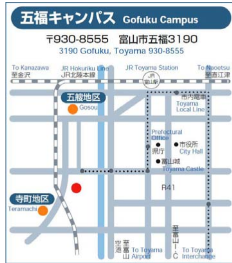
図3 旧・五福キャンパス周辺図

アクセスマップをリニューアルするにあたり、周辺図については実際の地図を極力省略せずに、ほぼ正確に描くこととした。目的地までの距離が把握できるように縮尺も明記した。