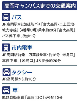
図4 高岡キャンパスまでの交通案内

右横に各キャンパスへの交通機関の利用案内と所要時間の目安を文書で明記した(図4)。