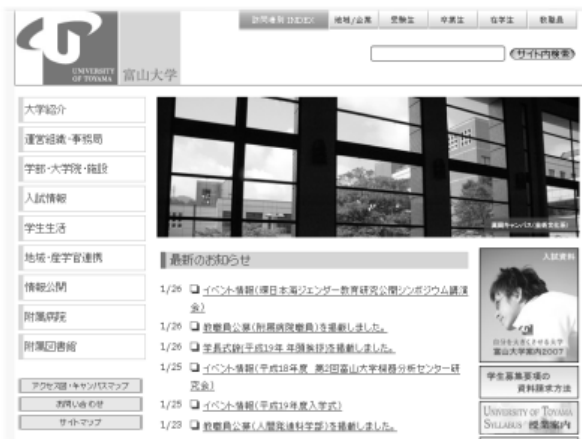
図1 富山大学ウェブサイトの index.html