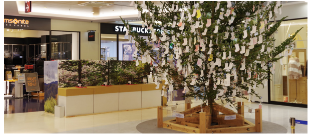
「CIRCULATING TREE PROJECT 展」館内 1F 特設会場 氷見の山から運んだ生木のクリスマスツリーを来場者と飾る