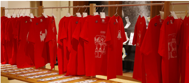
第10回企画展「GEIBUN GOODS 展」 GEIBUN & TOYAMA をテーマに、T シャツとバッジをデザイン