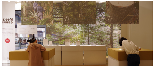
第15回企画展「CIRCULATING TREE PROJECT 展」 館内のクリスマスツリーに飾るオーナメントを描くスペース