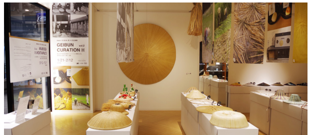
第16回企画展「GEIBUN CURATION 展 vol.2」 キュレーション領域による、菅笠活性化プロジェクト成果展