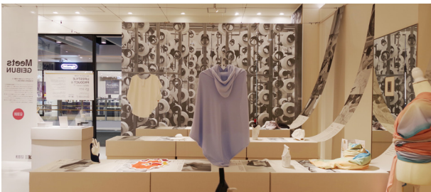
第12回企画展「LIFESTYLE PRODUCTS 展」 特殊機能性繊維を活用したライフスタイルプロダクトの提案