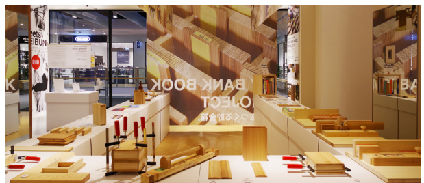
第18回企画展「MY BANK BOOK PROJECT 展」 共同研究「資産形成に資する教材デザインの研究」成果展