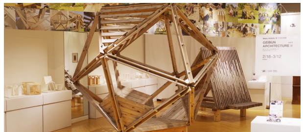
第17回企画展「GEIBUN ARCHITECTURE 展 vol.2」 建築領域による、学生自ら設計制作したシェルターの展示