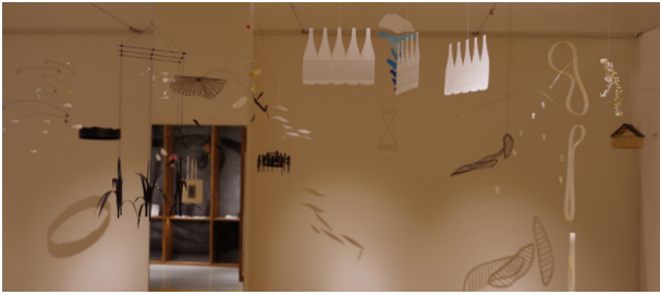
第9回企画展「GEIBUN PROPOSAL 展 case#02」 “富らしさ”のある「とやまモバイル」の提案