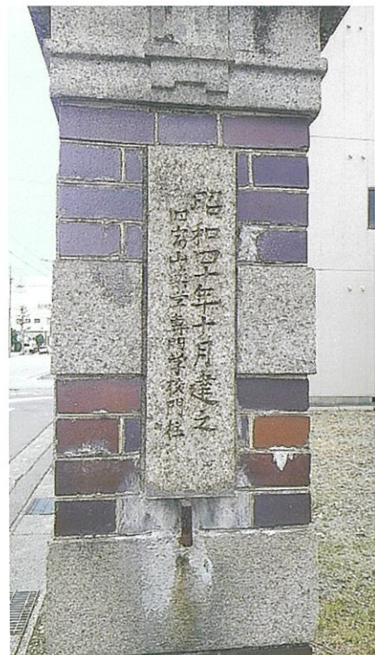
「富山薬学教育発祥之地」記念碑（富山市梅沢町）