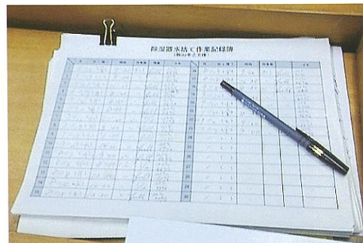
(室内の除湿機の水を廃棄した記録)