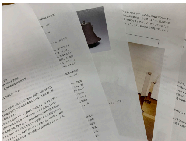
写真1 金屋町ゆかりの作家をまとめた資料