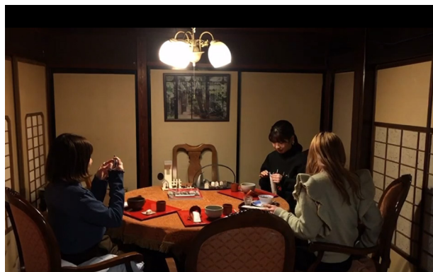
写真2 町巡りグループ動画（大寺商店でのカフェシーン）