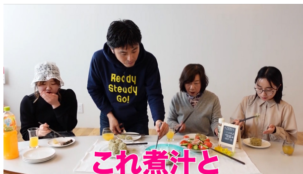
写真3 企画グループ動画（実食のシーン）