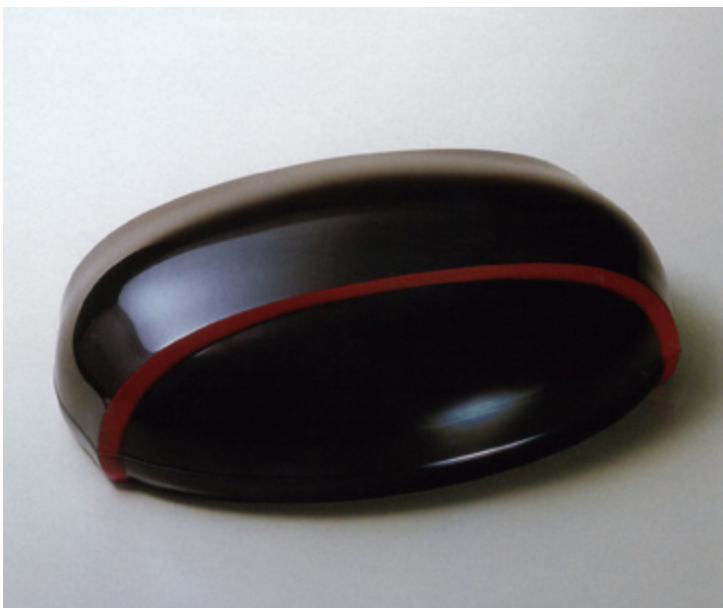
作品名 : 乾漆楕円合子 技法 : 乾漆技法 素材 : 漆、麻布、紙、金粉 寸法 : 縦 29 × 横 20.5 × 高さ 9.5 cm 制作年 : 2006 年 展覧会名 : 第 53 回日本伝統工芸展 入選 : Oval box, Kanshitsu, Makie