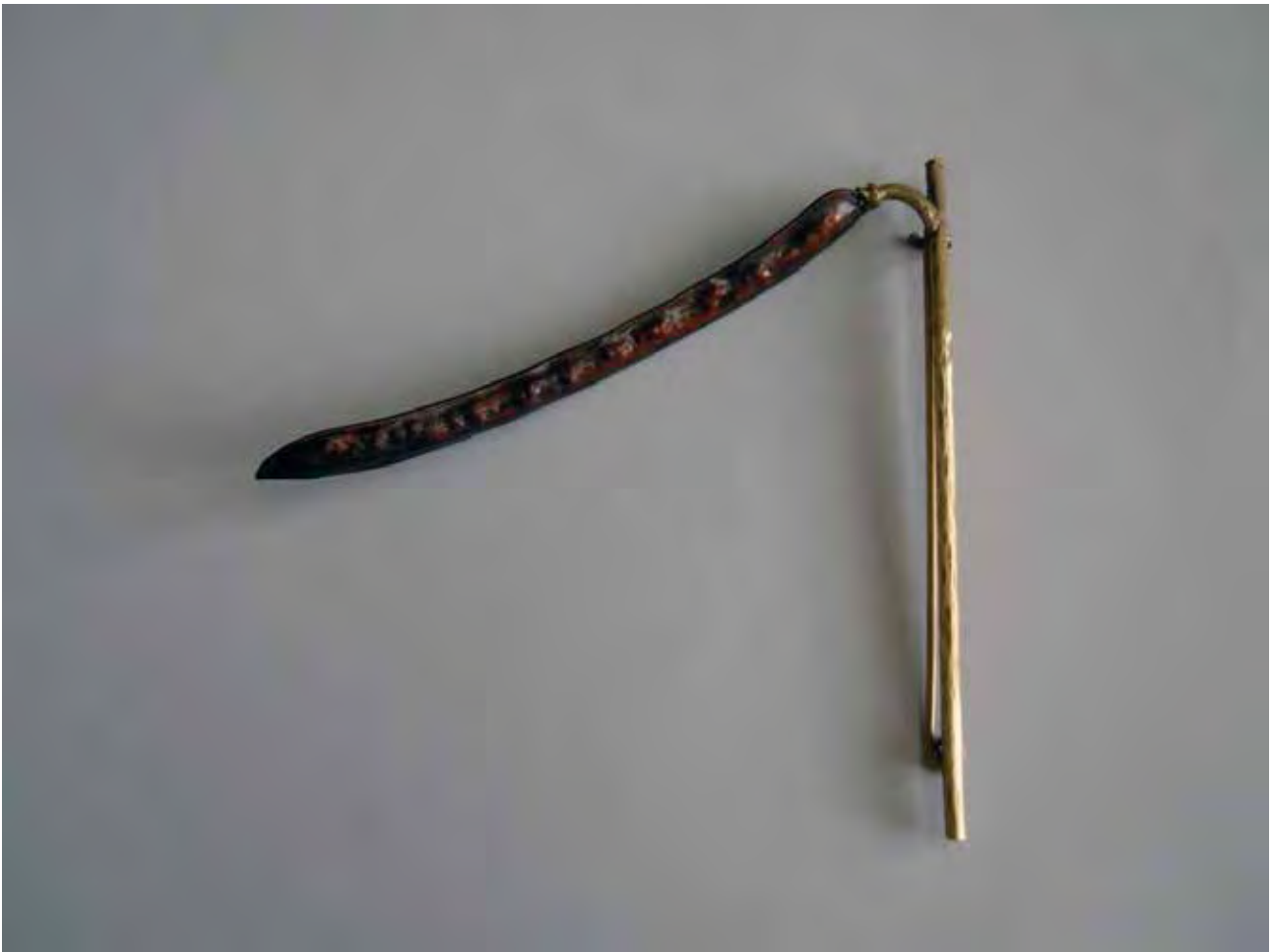
題名 : やぶつるあずき (ブローチ) 寸法 : 150×150×25(mm) 素材 : 銅, 黄銅 制作年 : 2012年 発表場所 : 第27回公募2012日本ジュエリーアート展