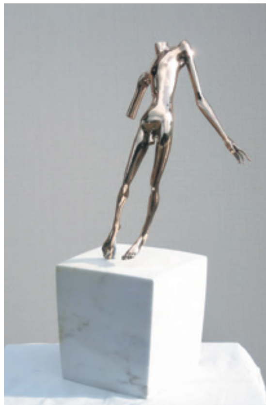
作品名：種をまくひと 寸法：W27/H52/D20cm 素材：ブロンズ、大理石 制作年：2007年 発表：第9回 大分アジア彫刻展