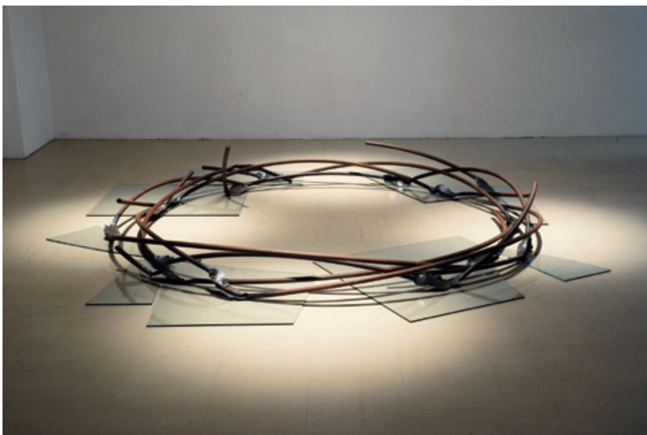
作品名：表出—鉄・CIRCLE 220— 素材：鉄 サイズ：H37 × W230 × D230cm