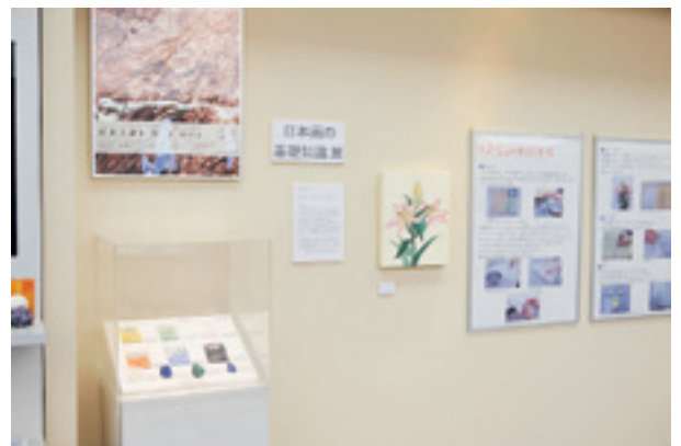
日本画の基礎知識展