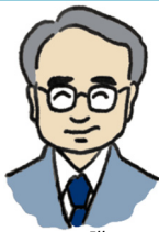
Illustration by K