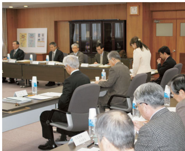
富山大学開放推進懇話会の模様