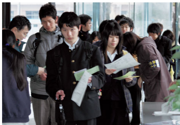
検査場へ向かう受験生

検査は、一般選抜(前期日程)及び専門高校・総合学科卒業生選抜の志願者2,174人(個別学力検査を課さない経済学部夜間主コースを除く)のうち2,086人が受験(受験率96%)しました。また、私費外国人留学生特別選抜も併せて実施され、63人が受験しました。