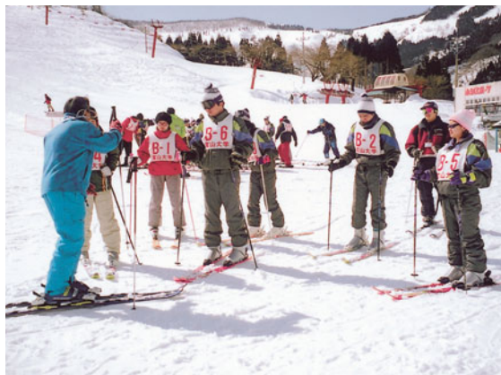
スキー体験研修の様子

また、スキー体験、橇滑りのほか、外国人留学生の出身大学や地域の紹介、参加者の抱負などを発表する交流会が行われました。