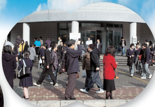
平成17年度入学者選抜個別学力検査(前期日程)(2月25日)