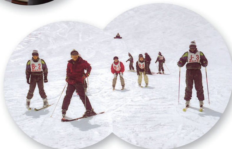
外国人留学生スキー体験研修(2月15日~16日)