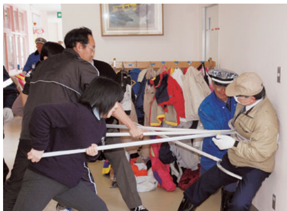
不審者を取り押さえる教職員

クラス担任等は、侵入から園児の避難、不審者の取り押さえまでは約5分程度の間だったが、とても長く感じ、改めて日頃の訓練の大切さを痛感したと話していました。