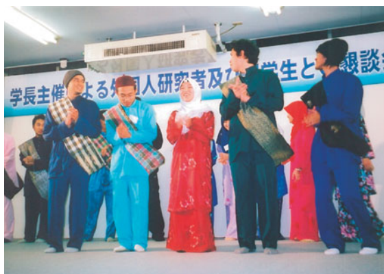
民族衣装を身につけて合唱する留学生

アトラクションでは、今回初参加の学生サークルの吹奏楽部による演奏、中国、韓国留学生による歌、マレーシア留学生による民族衣装を身に纏った歌と踊り、職員と留学生によるマジックショーなどが次々と披露され、最後に参加者全員が一体となって「北国の春」と「明日があるさ」を大合唱し、盛会のうちに懇談会を終了しました。