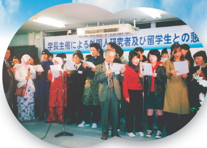
学長主催による外国人研究者及び外国人留学生との懇談会(12月17日)