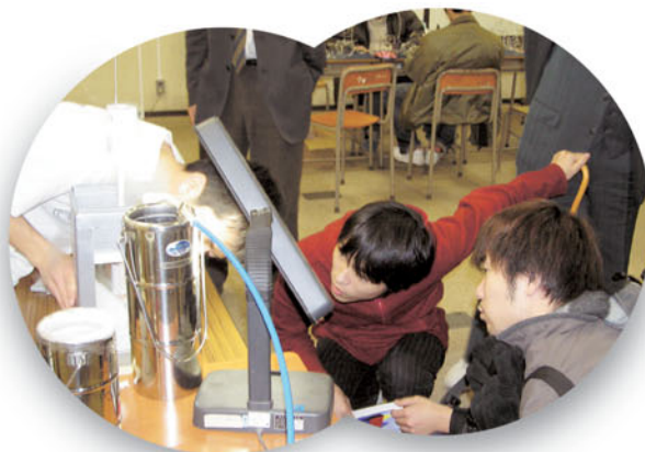
第2回学生ものづくりアイデア展 in 富山(12月17日)