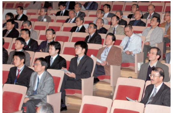
講演に耳を傾ける職員

講演会には、17年10月に県内3大学の統合を控えていることから、富山大学のほか富山医科薬科大学と高岡短期大学からも参加者があり、約200人の聴衆は熱心に耳を傾けていました。