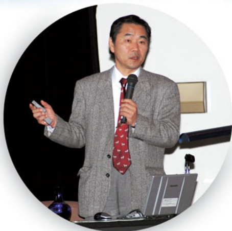
特別講演会「国立大学の法人化と大学運営」(12月16日)