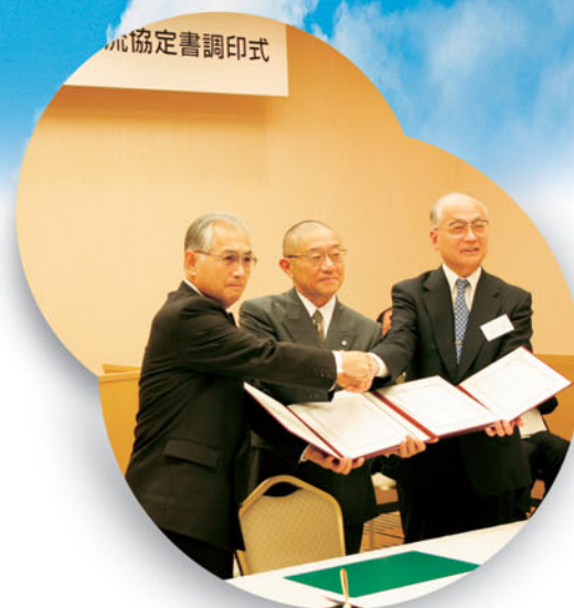
新潟・長崎3大学間・学部間協定調印 (10月25日)