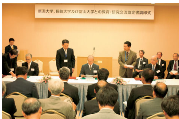
新潟大学、長崎大学との調印式の模様

引き続き「新潟大学工学部、長崎大学工学部及び富山大学工学部の間における単位互換に関する協定書」とその実施要項に3工学部長が署名し、協定書を交換して調印式を終えました。