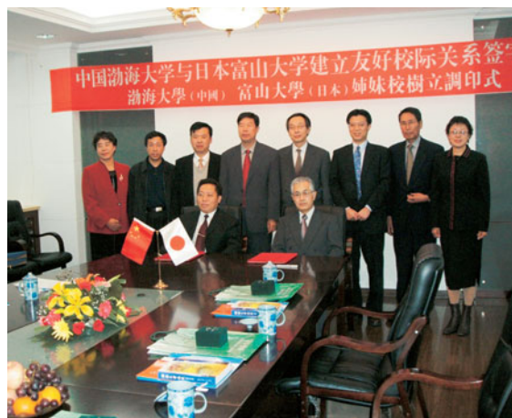
渤海大学との調印式の模様

また、今回の訪中では、1999年に学術交流協定を締結した大連理工大学及び蘭州大学も訪問し、教員、学生交流等の実績を積み上げてきた両大学と引き続き交流を深めるため大学間の学術交流協定を更新しました。