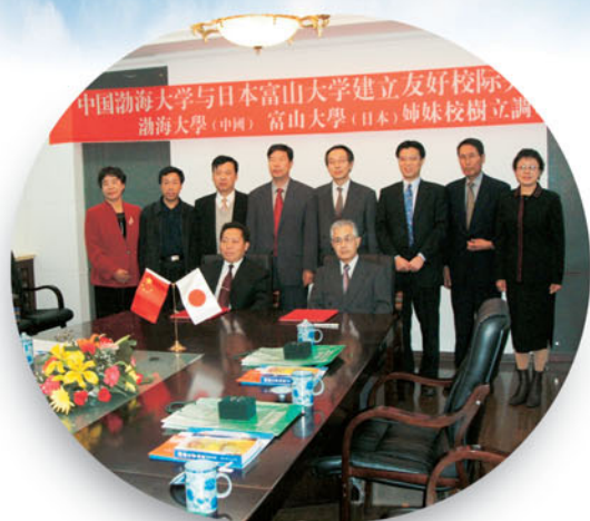
中国遼寧省渤海大学と学术交流協定締結 (10月15日)