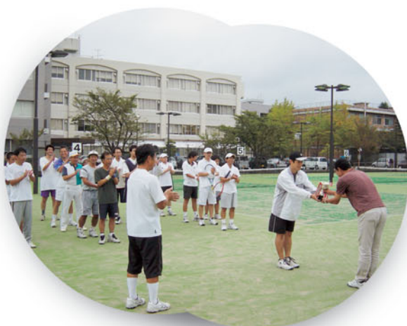
学内硬式庭球大会を実施 (10月2日, 21日)