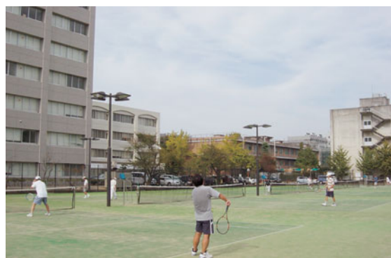
学内硬式庭球大会の様相