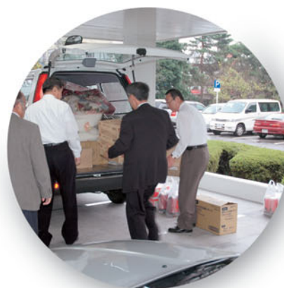
「新潟県中越地震」被災校に救援物資搬送 (10月25、26日)