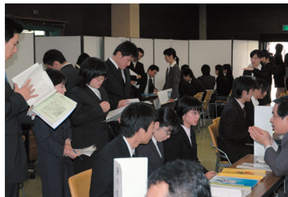
真剣な表情で説明を聞く学生

参加した学生からは、「学内なので時間の都合がつきやすく良かった」、「富大生限定ということで人数も少なく効率的に企業回りが出来て良かった」、「企業も「富大生を対象に」という気持ちできていると思うので、こちらとしても質問しやすかったし、心にゆとりを持って臨めた。」などの声があり、好評でした。