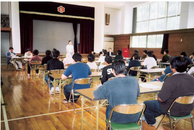
オリエンテーション風景

また、合宿研修では、オリエンテーションのほかに、先進的な科学技術を取り入れた菓子製造企業や世界遺産に指定されている五箇山の合掌づくりを見学するなど日本文化等についても理解を深めました。