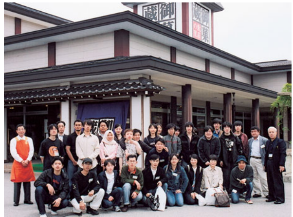
おかき製造会社見学