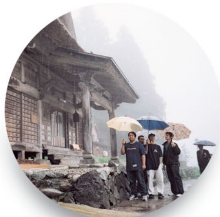
●外国人留学生（学部新入生）合宿研修（5月15～16日） 「世界遺産五箇山合掌集落見学」