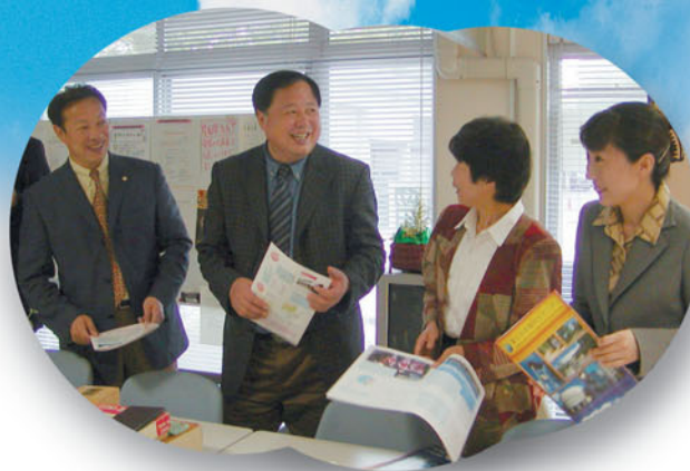
●留学生センター教員と談笑する蔵副校長（5月10日）