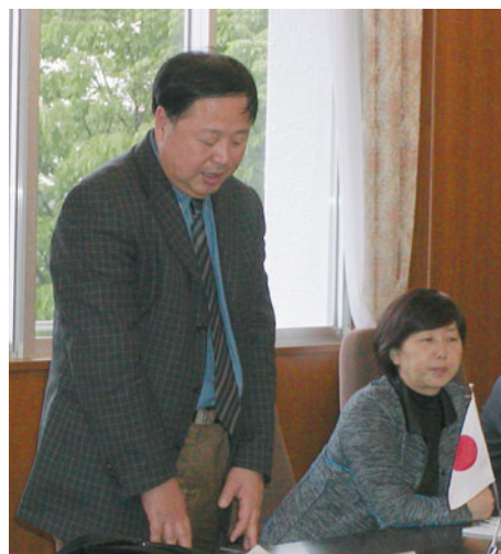
懇談会で挨拶する藏副校長