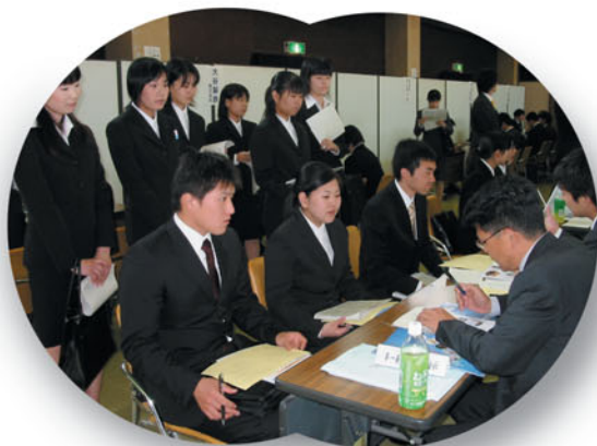
●企業合同説明会（5月12日）