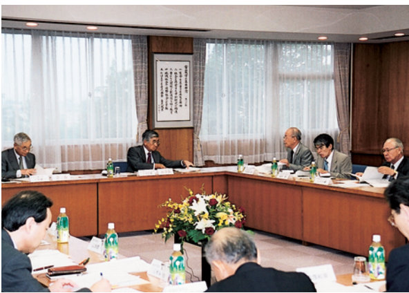
運営諮問会議の様相

その後、本学から、県内国立3大学の再編・統合について報告があり、各委員から以下のような意見等がありました。