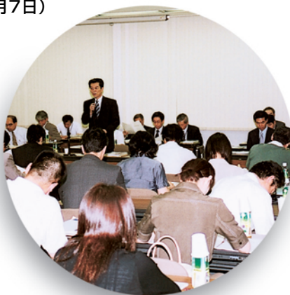
●高等学校と富山大学との入学試験に関する懇談会（7月25日）