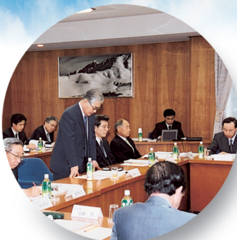
●平成15年度第1回運営諮問会議（7月7日）