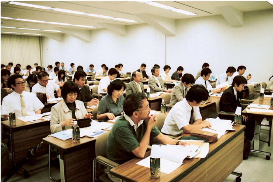
高校進路指導担当教諭と懇談

会議では、本学から平成16年度富山大学入学試験の概要や富山県内の国立3大学の再編・統合、国立大学行政法人化の検討状況並びに各学部（学科・課程）の特色などについて説明があった後、高等学校側からの質問・要望等について回答及び意見交換が行われ、充実した懇談会となりました。