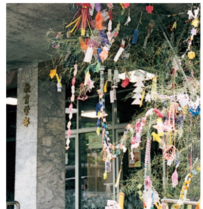
教育学部の七夕飾り

この七夕飾りは、19か国から来ている留学生たちがそれぞれの願い事を母国語や日本語で短冊に書いて飾り付けた国際色豊かなもので、短冊には国際情勢を反映した「世界平和」や「健康第一」、また、現実的な「日本語がうまくなりますように」や「大学院合格」など、たくさんの願い事が込められています。この七夕飾りにより、同センターは一段と賑やかになりました。また、同日、教育学部玄関においても、竹井研究室の学生たちの手により七夕飾りが飾り付けられ、メインストリートを通る人たちの目を和ませました。