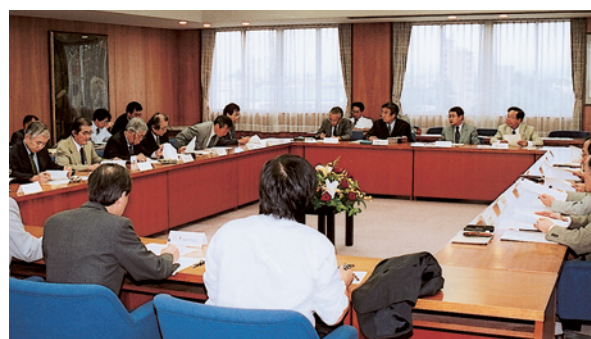
新大学創設準備協議会