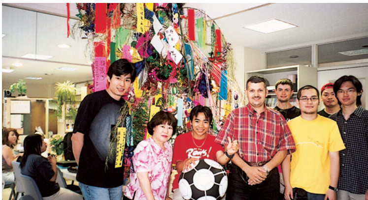
留学生センターの七夕飾り

留学生センターでは、外国人留学生たちが授業の合間をぬって恒例となった「七夕飾り」を準備し、7月3日（木）に同センター玄関に飾り付けました。