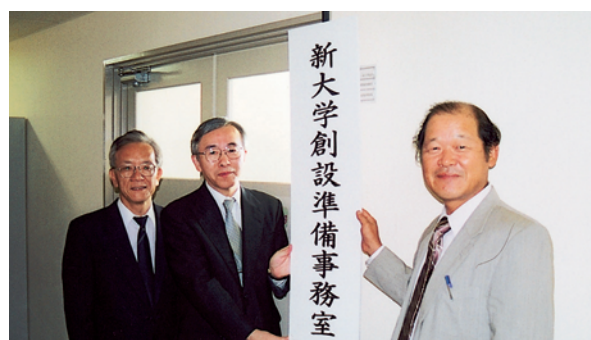
新大学創設準備事務局 看板上掲

なお、事務局には、3大学から7名が専任スタッフとして配置され、協議会及び部会の運営や資料の作成、3大学の連絡調整などの事務を精力的に行うことになりました。