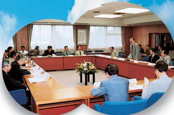
●新大学創設準備協議会（7月8日）