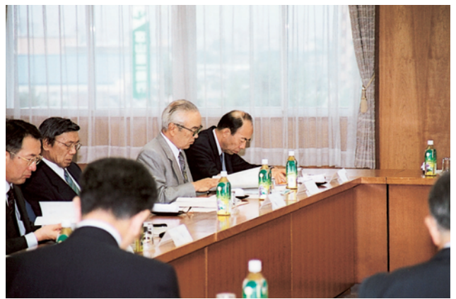
運営諮問会議の様相