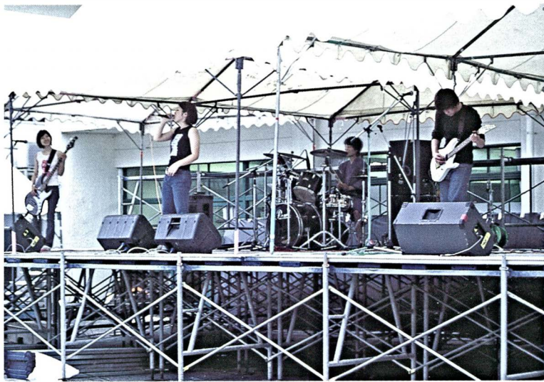
第46回富山大学のーシーン

編集 富山大学総務部企画室 〒930-8555富山市五福3190 TEL.(076) 445-6029 FAX.(076) 445-6033 印刷所 あげぼの企画(株) 〒930-0031富山市住吉町1-5-8 TEL.(076) 424-1755 FAX.(076) 423-8899