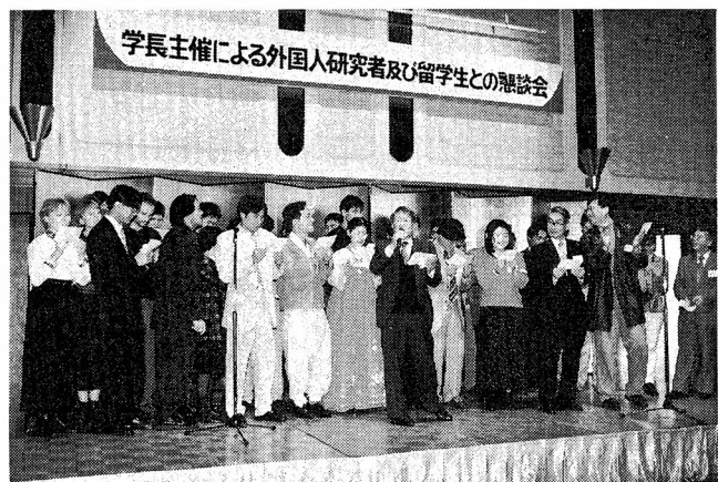
▲ 学長を囲み合唱する教職員と留学生