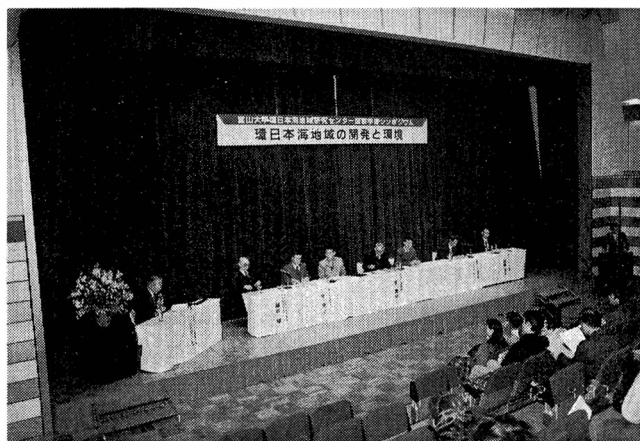
▲ シンポジウム総合討論

シンポジウムには、多数の企業関係者、県関係者、教官、学生や一般市民等が参加し、環日本海地域における開発と環境の現状や今後の両立の在り方についての提言等を熱心に聴き入っていました。