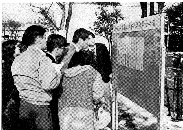
▲ 合格発表を見る受験生、父兄等 （平成9年12月12日）