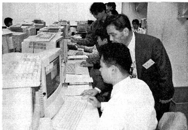
▲ 講師、アシスタントの指導を受け熱心に実習を受ける受講生