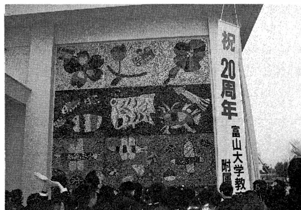
▲ 完成した壁画を眺める児童生徒たち