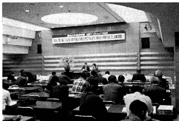
▲ 公開ワークショップ

このワークショップは、対岸諸国の研究機関との共同研究を推進すると同時に、これまでの研究成果を内外に発信することを目的として開催するものであり、ロシア、韓国、中国及び国内の研究者を招き、テーマに関する各々の研究成果が報告され、引き続き参加者による熱心な研究討論が展開されました。