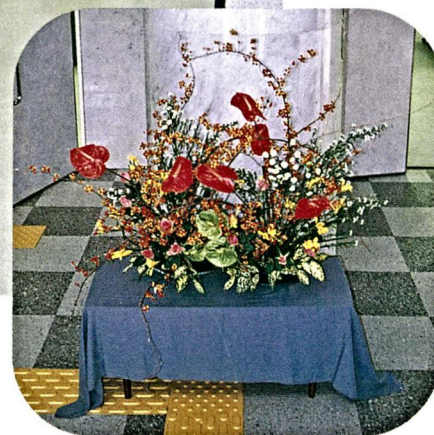
▲ 平成8年度教職員文化展(平成8年11月6日～8日:黒田講堂会議室)