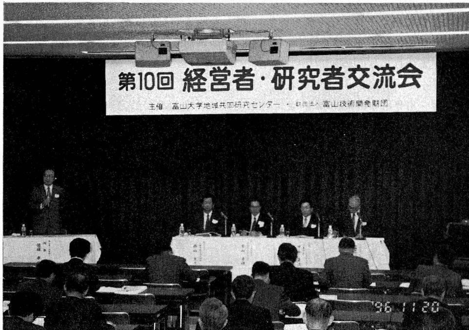
▲ パネルディスカッション