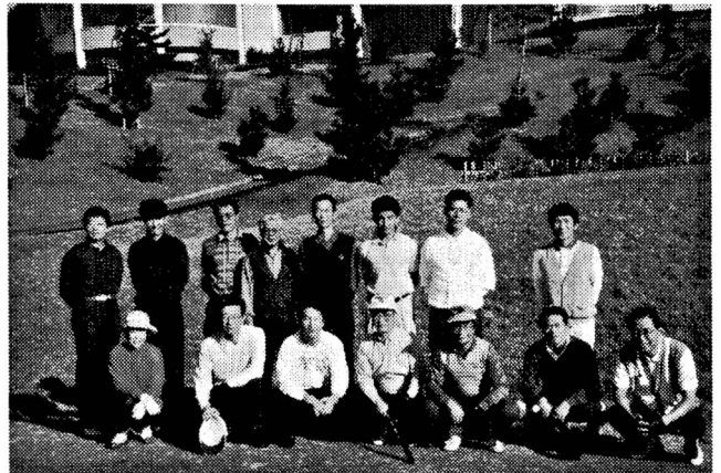
▲ ゴルフ大会の参加者