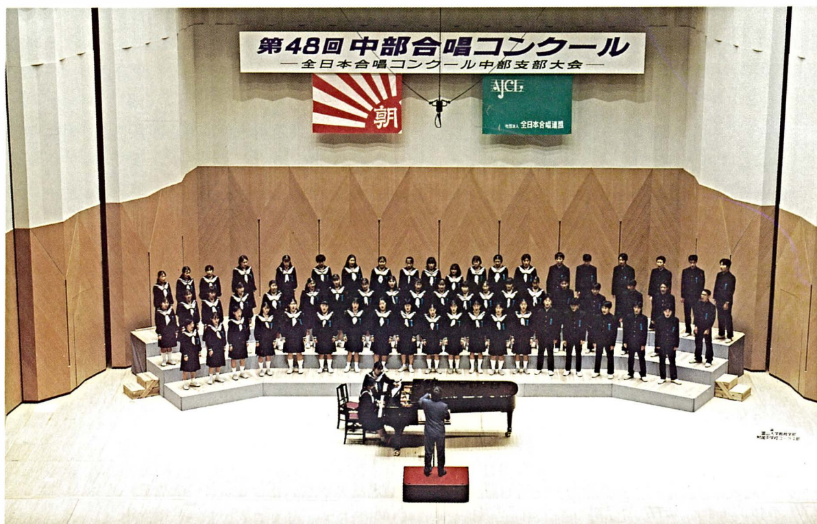
▲ 第48回中部合唱コンクール中学校の部で見事なハーモニーを披露し、金賞を受賞した 附属中学校コーラス部 (平成7年10月1日：三重県総合文化センター大ホール)