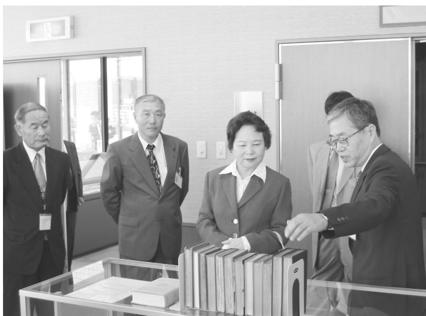
専門員から説明を受けられる遠山大臣

ヘルン閲覧室には、展示ケース上にハーンが日本で生活した14年間に海外で出版した13冊の図書が配置されており、中でも、最初に出版された「知られぬ日本の面影（下巻）」に収載されている「The Japanese Smile（日本人の微笑）」は、日本人の性格の特性を海外に紹介した作品として有名であることの説明には、大臣には既知のこととして頷いておられた。