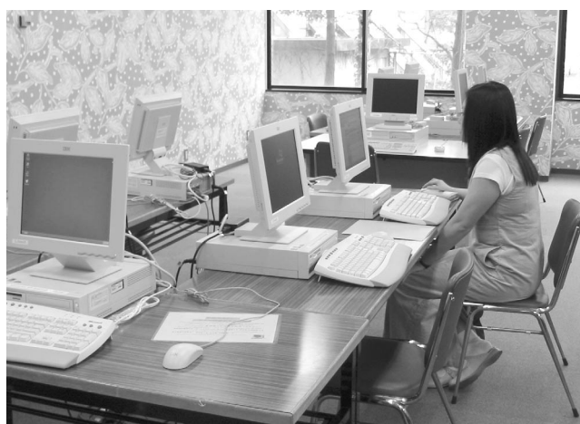
本館1階マルチメディアコーナーに設置されている留学生用情報端末機