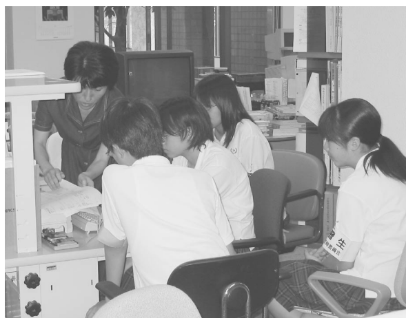
データの検索を教わる中学生

ち、図書の配架整理、現物貸借、文献の複写サービスなどを体験してもらいました。パソコンで他大学の図書館と図書資料に関する情報のやり取りを行っていることや、図書の配架、貸出図書の発送、文献の複写など、初めての体験にとまどいながらも一生懸命に取り組む姿が印象的でした。