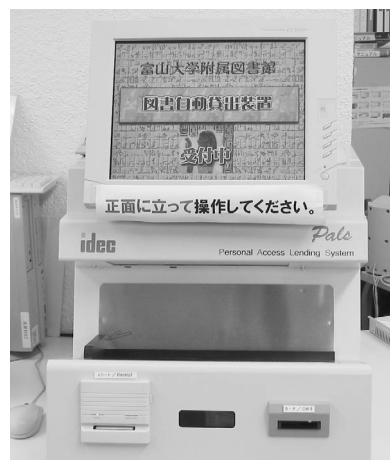
1階カウンターに設置されている図書自動貸出装置

(ただし、現在のところ図書館利用証が磁気カードでない教職員及び学外者は利用できません。)