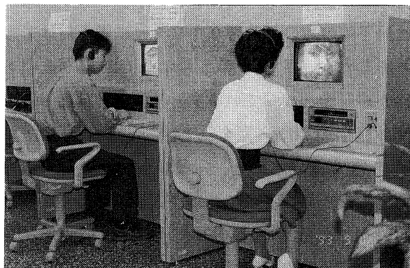
▲ 2階自由閲覧室内に設置されたビデオコーナー