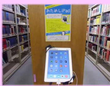
カウンター横に、おためしiPad設置中！

図書館ではiPadの館内貸出サービスを行っています。本を読むためのアプリから、英語学習用アプリ、グループ学習に役立つアプリなど様々なアプリを導入しています。学習時のWeb検索用として使うのにも最適です。カウンターで簡単な手続きをするだけです。是非ご利用ください。 ※iPadでインターネットを利用するには、基盤センターのIDとパスワードで無線LANの設定をする必要があります。