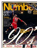
『Number』 文藝春秋社発行の スポーツ総合雑誌 (隔週発行)