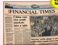
『Financial Times』 FT社発行の 国際ビジネス新聞