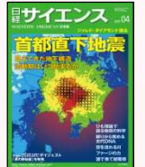
『日経サイエンス』 日経サイエンス社発行の 総合科学雑誌(月刊)