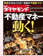
『週刊ダイヤモンド』 ダイヤモンド社発行の ビジネス週刊誌