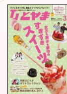
『TJとやま』 シー・エー・ピー発行の タウン情報誌(月刊)