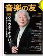
『音楽の友』 音楽之友社発行の クラシック音楽総合雑誌 (月刊)