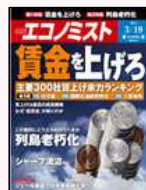
『エコノミスト』 毎日新聞社発行の ビジネス週刊誌