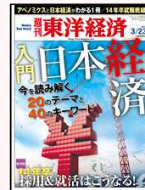
『週刊東洋経済』 東洋経済新報社発行の ビジネス週刊誌