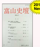
『富山史壇』 越中史壇会発行の 富山の歴史に関する 学術雑誌(年3回発行)