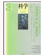
『科学』 岩波書店発行の 総合科学雑誌(月刊)