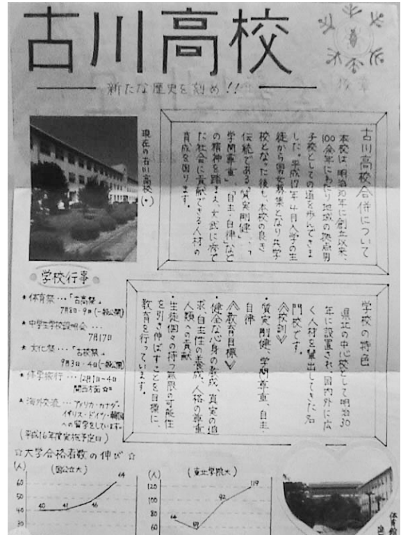
図3 中学生が仕上げたパンフレット

ラフスケッチの段階では、伝えたい内容を表す言葉やキーワードを考え、小見出しを工夫していた。また、小見出しを考えることで伝えたいことは何か、再確認する