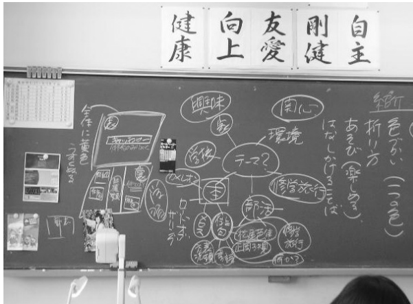
図1 授業中の板書の様子

生徒はラフスケッチをもとに、パンフレットを作成した。作成したパンフレットの例を図3に示した。