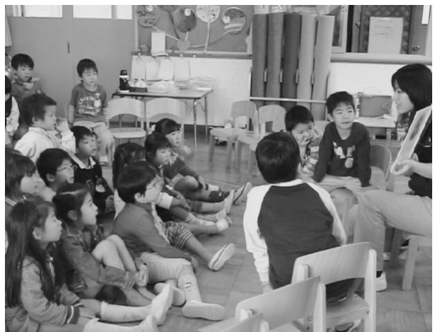
Figure 6 2日目の話し合いの様子