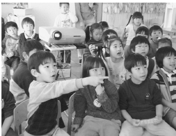
Figure 3 ビデオを見る子どもたち

いないとわかった時点で、映像に興味をなくしてしまう子どもも多く見られた。また、ビデオ全体を通して見たいという思いが強い子どもたちもあり、実践者が途中でビデオを止めて話をすることに対して抵抗があったように思われる。