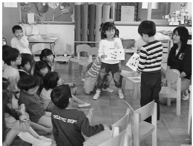
Figure 7 にじうおと友だち役のロールプレイ