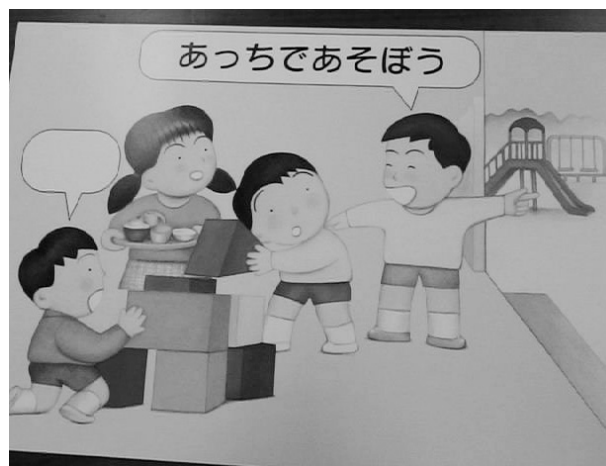
Figure 8 パネル1（富山県教育委員会, 2004）