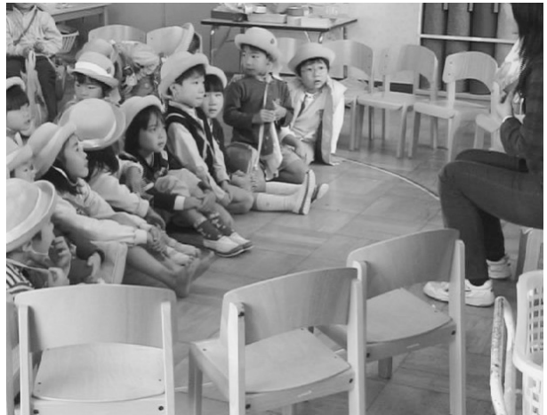
Figure 5 1日目の読み聞かせの様子