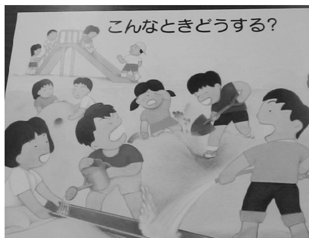
Figure 9 パネル2（富山県教育委員会, 2003）

題材の決定理由： どちらのパネルに描かれている場面も幼児が日常的によく経験するできごとであり、子どもたちが自分の体験を想起しながら話し合いができると考えられる。