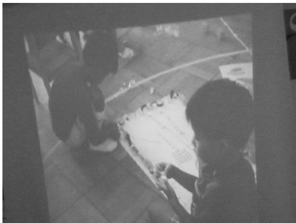
Figure 2 ビデオの上映（看板作りの場面）

実践中の子どもたちの様子： 子どもたちにとって今回のような活動はなじみのないものであり、何をする時間なのかわからなかったため、落ち着きがないように感じられた。また、子どもたちはいつも自宅で自分が中心に映っているビデオを見ているためか、自分がビデオに映って