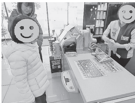
写真2 対象児がコンビニで買い物をしている様子

買い物学習の際、A児は当初ICカードに戸惑っていたが、友達や教師が模擬店にてICカードを使って買い物をする様子を見たり、実際にICカードを使って買い物をしたりする経験を重ねることでICカードを使えばお金がなくても買い物ができることを理解し、教師の言葉掛けがなくても、一人でレジに商品を持って行き、ICカードを取り出して商品を購入できるようになった。そしてまとめの学習として、実際のコンビニエンスストアにて買い物を行った。対象児は様々な商品を見た後に、模擬店には置いていなかった商品を選び取り、レジにてICカードを利用して買い物することができた(写真2)。