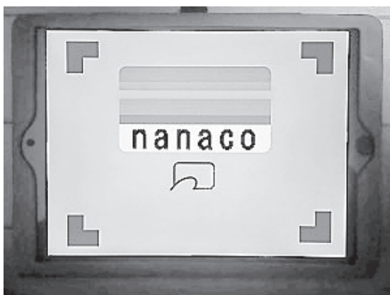
写真1 「ぴろりん」の表示画面