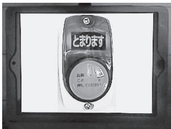
写真4 バスの降車ボタンの表示画面