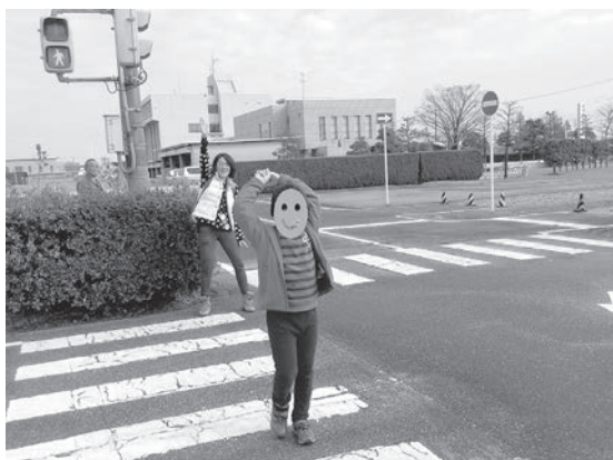
写真6 交通安全博物館にて横断歩道を渡る様子

指導の際、信号機の色の意味や車にぶつかる怪我をすることなどを事前にC児に伝えてから指導を行った。初めは、教師の言葉掛けを聞いて信号機を見ることができても、信号機の意味が理解できず、赤信号で渡ろうとし、車役の教師にぶつかることが何度もあった。しかし、信号機の意味を聞き、擬似の交差点で練習を重ねることで、赤色は止まること、青色は渡って良いことが少しずつ分かるようになってきた。実際の横断歩道では、まだ教師の言葉掛けがないと信号機に注目したり安全に渡ったりすることは難しいが、教師が手を繋がずに傍で見守りながら横断歩道を渡ることができるようになった（写真6）。