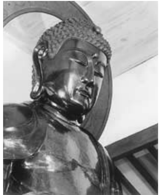
右斜め側面からの頭部