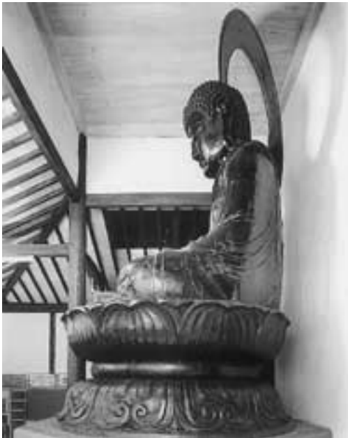
左真横からの全景(胎内へ入るための背中の扉の蝶番がかすかに見える)