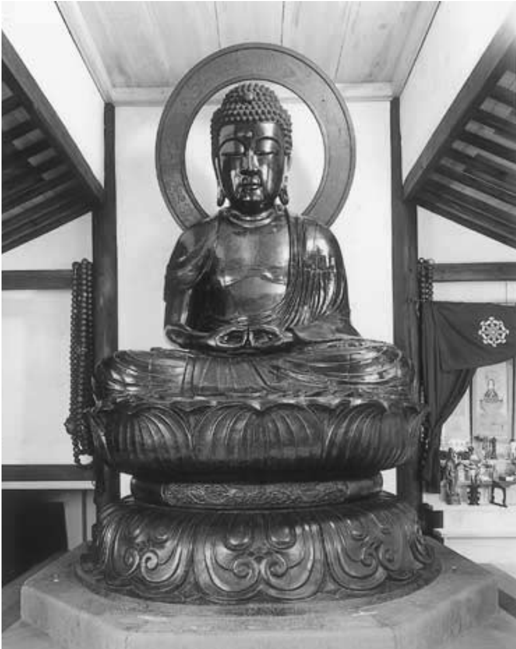
武生大仏正面全景(カメラ位置を大仏腹部の高さに上げて撮影したもので、普段この角度から拝観することはできない)