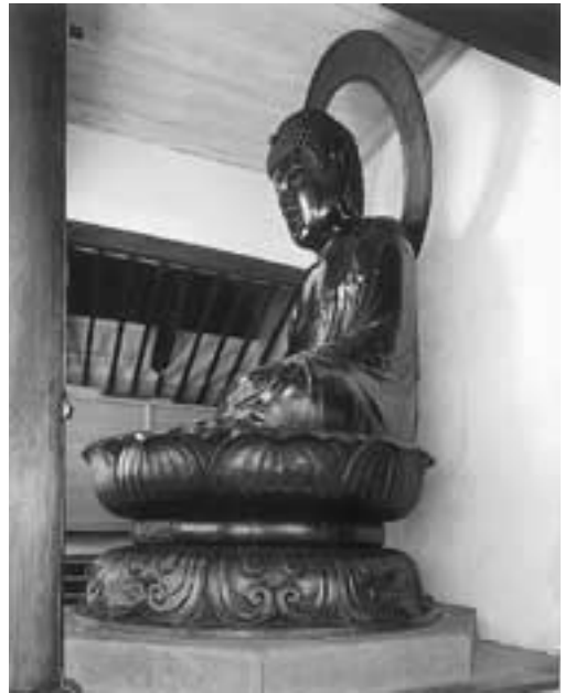
左斜め側面からの全景