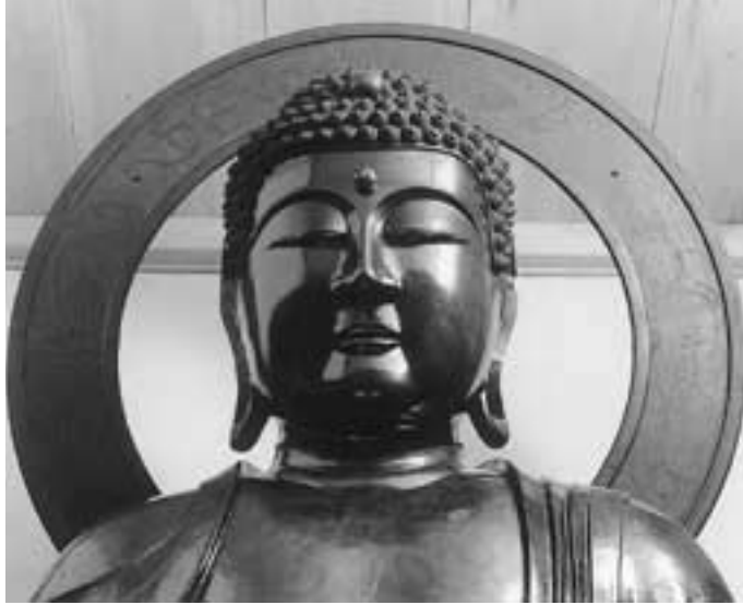
大仏頭部(通常の拝観角度からの撮影。光背は青銅の鑄造製で墨書の文様が見える)