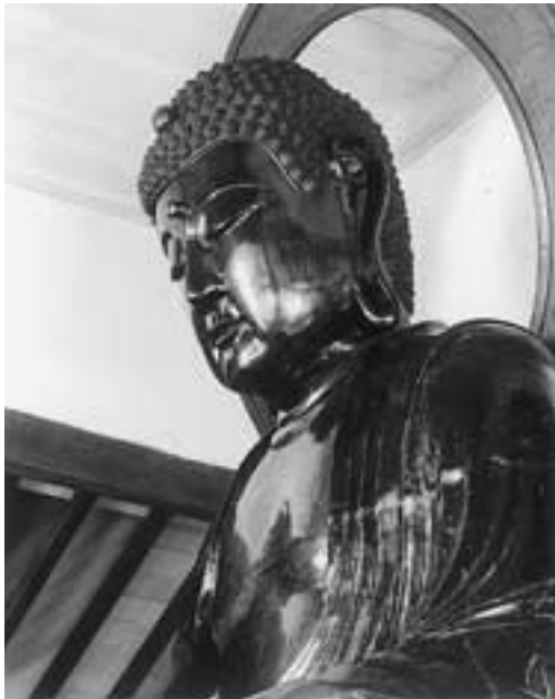
左斜め側面からの頭部