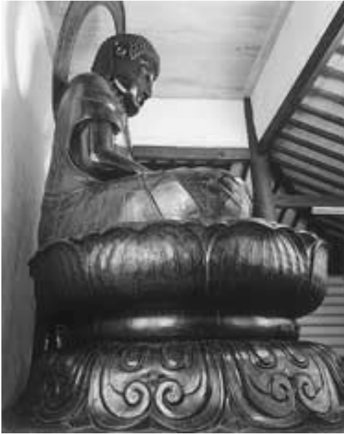
右真横からの全景(光背は大仏本体二箇所差し込んで固定されている)