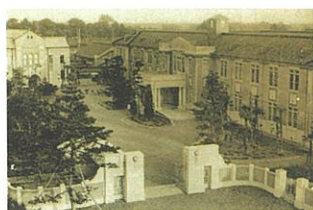
旧制富山高等學校校舎(現、馬場記念公園)