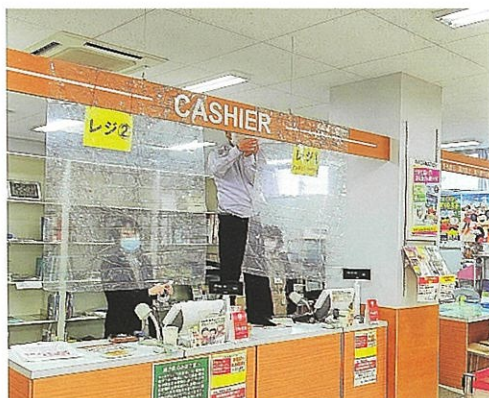
シートを取り付ける生協(4月16日)