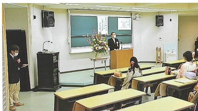
2019年度人文学部学位記授与式

危機意識が一気に高まったのは3月末以降であろう。入学式は急遽配信形式に変更され、前期の講義開始も4月23日に延期された。その後はMoodle等を利用しながらオンラインでの授業が始まり、実験等について対面形式が再開されたのは6月になってからだった。また講義開始までの間に、生協のレジ周辺や事務室ではウィルス対策として透明シートが設置されたほか、図書館では入館制限が実施された。