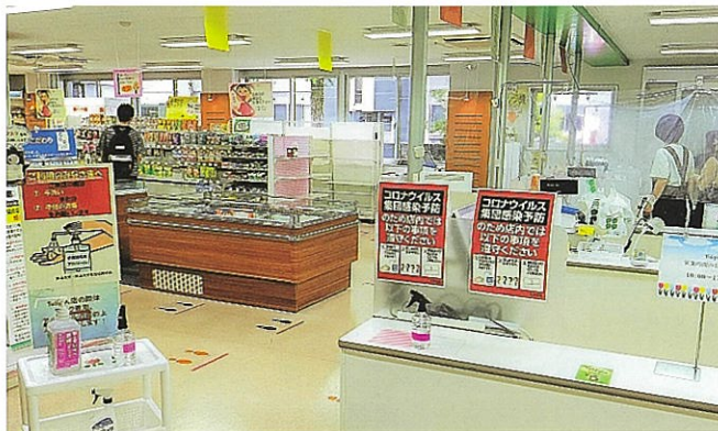
消毒液を置くTULIP(8月13日)