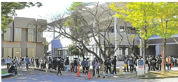
対面授業開始後、本店食堂に並ぶ学生(10月20日)

本稿では紙幅の関係から、五福キャンパスに関する説明に終始した。杉谷・高岡両キャンパスおよび各施設等でもどのような状況にあったか、大学アーカイヴズ宛てにご連絡をいただければ幸いである。