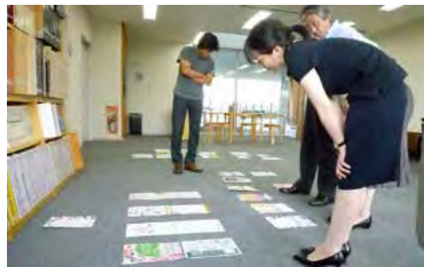
図 12：県内若手クラフト作家の展示販売会「クラフトマンズギャザリング」のリーフレットは、学部「CG デザイン」の授業でデザインしたものから選定した。