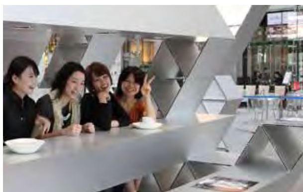
図 15：金屋町一帯を会場にして開催している「金屋町案内 in さまのこ」を東京駅前の丸の内で開催。合わせて「地方からの発信」をテーマとしたトークイベントを開催した。