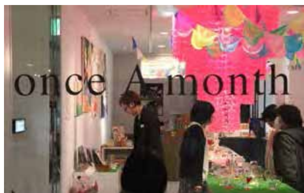
図 16：芸文ギャラリーの展示企画から生まれた「図工女子」は、渋谷の商業施設 PARCO からの要請を受けて東京でも開催。地方での取組が、全国レベルで評価されることが確かめられた。