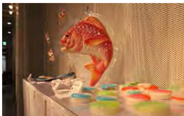
図 9：富山の特産のひとつである飾りかまぼこの新たな用途開拓を目標に行った商品開発プロジェクト「かまぼこ大学」。学生とプロのデザイナーがプロジェクトチームを構成して実施した。