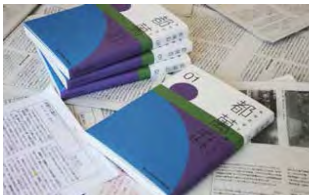
図 13：高岡の都市政策やまちづくりへの提言等をまとめた書籍『高岡芸術文化都市構想 都萬麻 01』。高岡市長はじめ関係者に配布し、芸術文化学部が推進する地域連携について情報発信した。