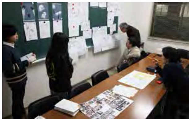
図 11：地域活性化プロジェクトである「金屋町楽市 in さまのこ」での使用を目標に商品開発プロジェクトとして展示用照明を制作した「プロダクトデザイン実習 B」の授業。