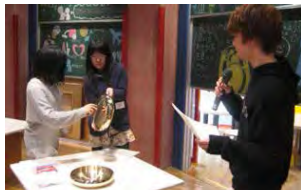
図 8：富山県デザイン協会及び県内企業と平成 19 年より開催しているワークショップの発表会。企業の若手開発者と 3 ヶ月～半年間をかけてテーマにもとづいた商品開発を行った。