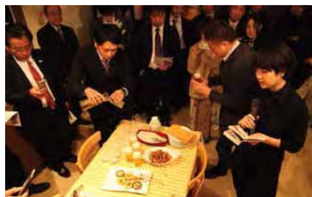
図 10：「かまぼこ大学」で開発したかまぼこの試食会。学生は業界関係者を前に、開発意図について説明を行った。配布したパンフレットも学生チームが制作した。