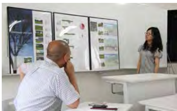
図5：研究科「デザイン学特論」の講評会は、環境デザインの分野で全国的に活躍している島津勝弘氏から講評を受けた。特徴が際立つグラフの作成方法からプレゼンの仕方まで具体的な指導があった。