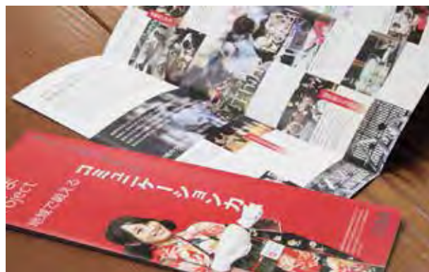
図 14：つままプロジェクトの意図や取組内容を紹介するパンフレットやホームページを制作し、学内外への広報を推進した。