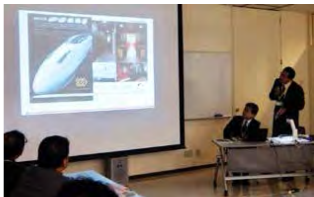
図 7：富山県と平成 18 年より開催している「富山県デザイン経営塾」。平成 23 年度は北陸新幹線の車両をテーマに「高岡伝統産業の新ジャンルへの展開」をテーマに開催した。