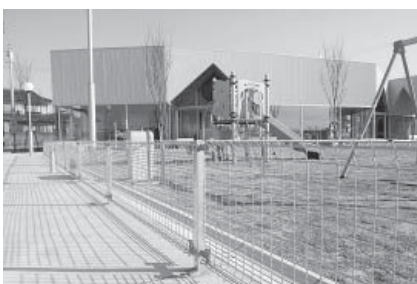
コミュニティセンターの外構フェンス