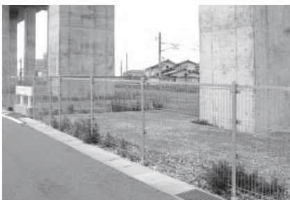
北陸新幹線高架橋下メッシュフェンス

富山大学との共同研究につきましては、平成21年よりスタートしました。当初は弊社から新規商品開発にあたり、メッシュフェンスのデザインをご相談させて頂いたのが始まりです。昨年には、高岡市内ホームタウン木津の庄におきまして、芸術文化学部との共同開発にてコミュニティセンターの外構フェンスをデザインから実施設計、製造、施工までを行いました。今後は、デザイン面だけではなく、新たな技術開発にも取り組んでいきたいと思っております。具体的には、溶接技術の向上面でアルミやマグネシウム、ステンレスなどの各種溶接を共同研究して技術的指導を仰ぎながら進めて行ければと存じます。ご協力の程、宜しくお願い致します。