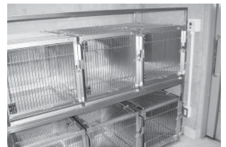
ライチョウ飼育ケージ